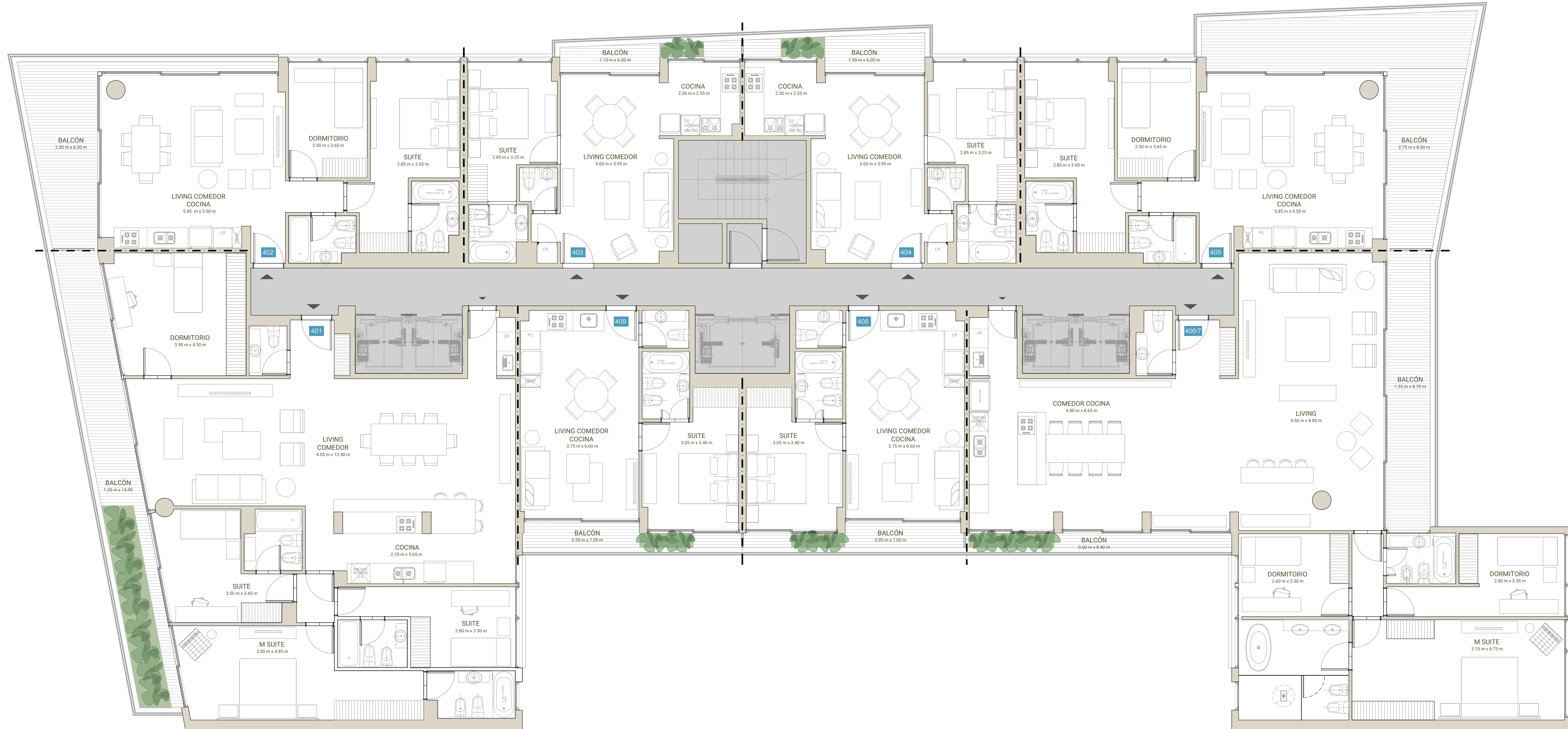
PLANTA PISO 4°