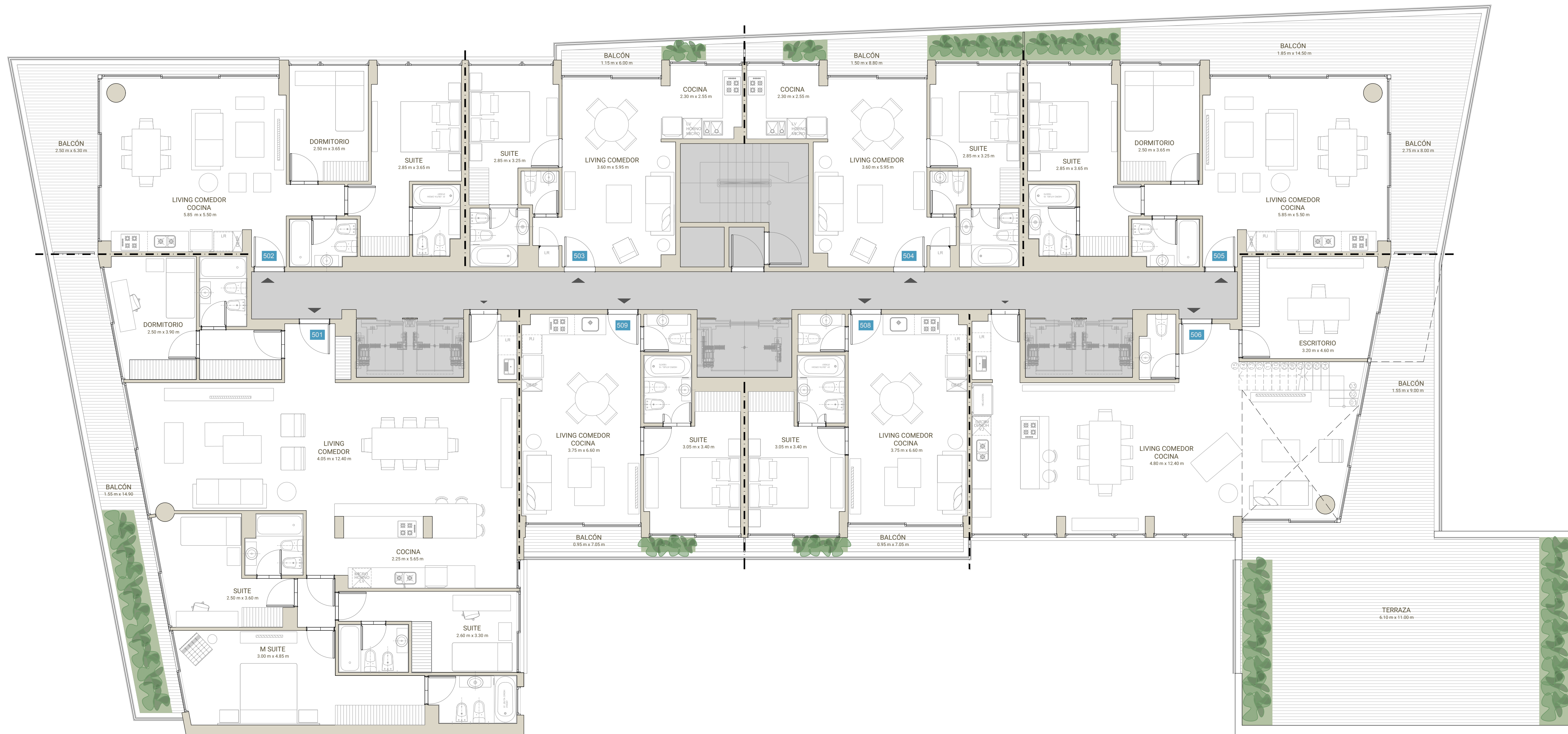
PLANTA PISO 5°